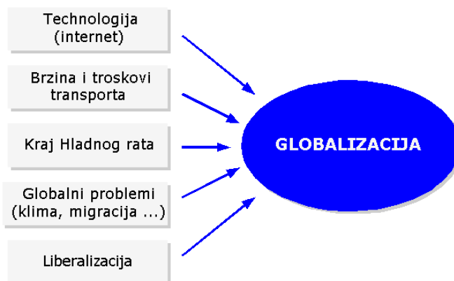
Slika 2. Uzroci globalizacije

Teško je govoriti o uzrocima nastanka globalizacije; otuda se o tom aspektu može govoriti iz ugla saglasnosti većine naučnika o nekim osnovnim uzrocima nastanka (slika 2)