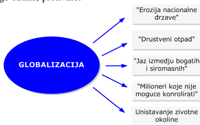
Slika 3. Posledice globalizacije

Primer: Jedan domaći savremeni srpski sociolog, inače skeptik po pitanju globalizacije, naveo je primer kako se uništava srpska duvanska industrija i podređuje Zapadu. Naime, prema njegovim rečima, kada zapadna razvijena država ima konkurenciju u nekoj slabo razvijenoj državi u bilo kom pogledu, pa i u duvanskoj industriji, ne libi se bilo kakvog načina da se iste i reši. On ističe da je tokom bombardovanja 1999. godine fabriku Srpske duvanske industrije u Nišu planski gađala ratna avijacija SAD, ne bi li na taj način onespobila proizvodnju i uništila konkurentnost naše fabrike u zapadnoj Evropi. Da stvar bude još lepša, nedugo nakon bombardovanja, tu istu fabriku kupio je upravo glavni konkurent našoj fabrici u zapadnoj Evropi, američki Filip Moris. (Boris Malagurski: Težina lanaca ) [7]