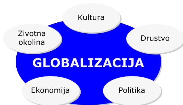
Slika 1. Dimenzije globalizacije

Ista situacija je i sa politikom , s obzirom da se većina političkih pitanja rešava na globalnom nivou. Države su u svetu industrijskih zemalja postale društveni akteri na globalnoj političkoj sceni. Dolazi i do novih kulturnih identifikatora , odnosno uticaja, kako neki kažu, zapadne kulture i kulturnih obeležja na današnje svetske države, i upravo integrisanje tih novih kulturnih identifikatora u kulturna obeležja zasebnih država.